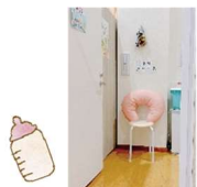
安心して授乳 相談ができる個室スペースもあります。